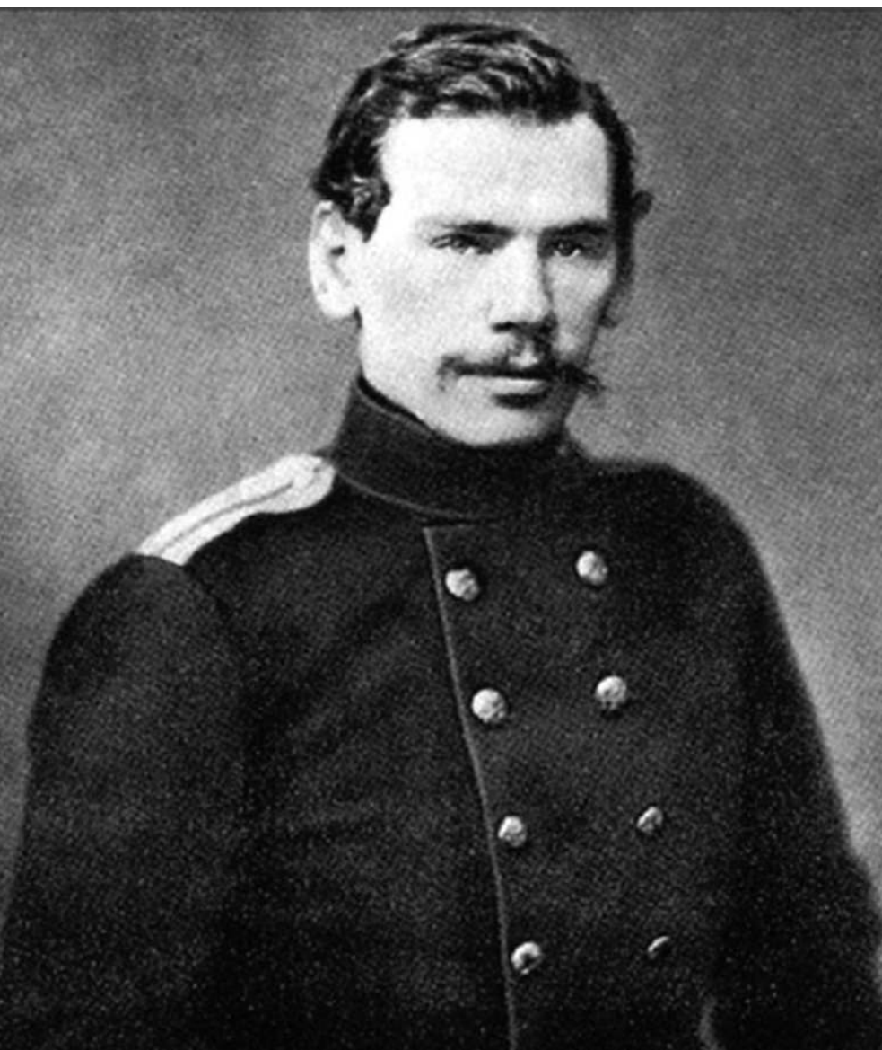
Lev Tolstoy, ofițer ce a luptat în războiul Crimeei (1855)