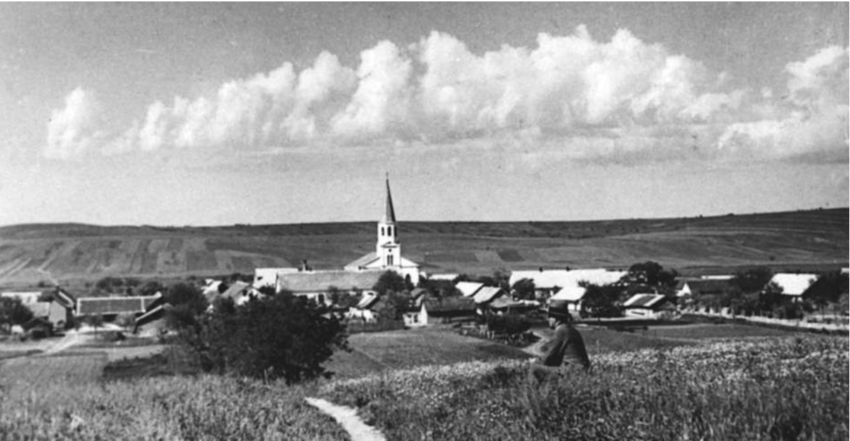
Vedere a localității Leipzig/Basarabia, prin 1930

de viață extrem de dure. Din cauza epidemiilor, mulți dintre ei și-au pierdut viața. Epizootiile, invaziile de lăcuste și recoltele proaste au anulat în repetate rânduri eforturile coloniștilor. Abia la mijlocul secolului al XIX-lea s-a conturat un avânt economic. Populația creștea, apăreau noi colonii. Aceste experiențe au fost concentrate în proverbul cunoscut de toți etnicii germani din Basarabia: „Primilor – moartea, copiilor – nevoile, nepoților – pâinea”.