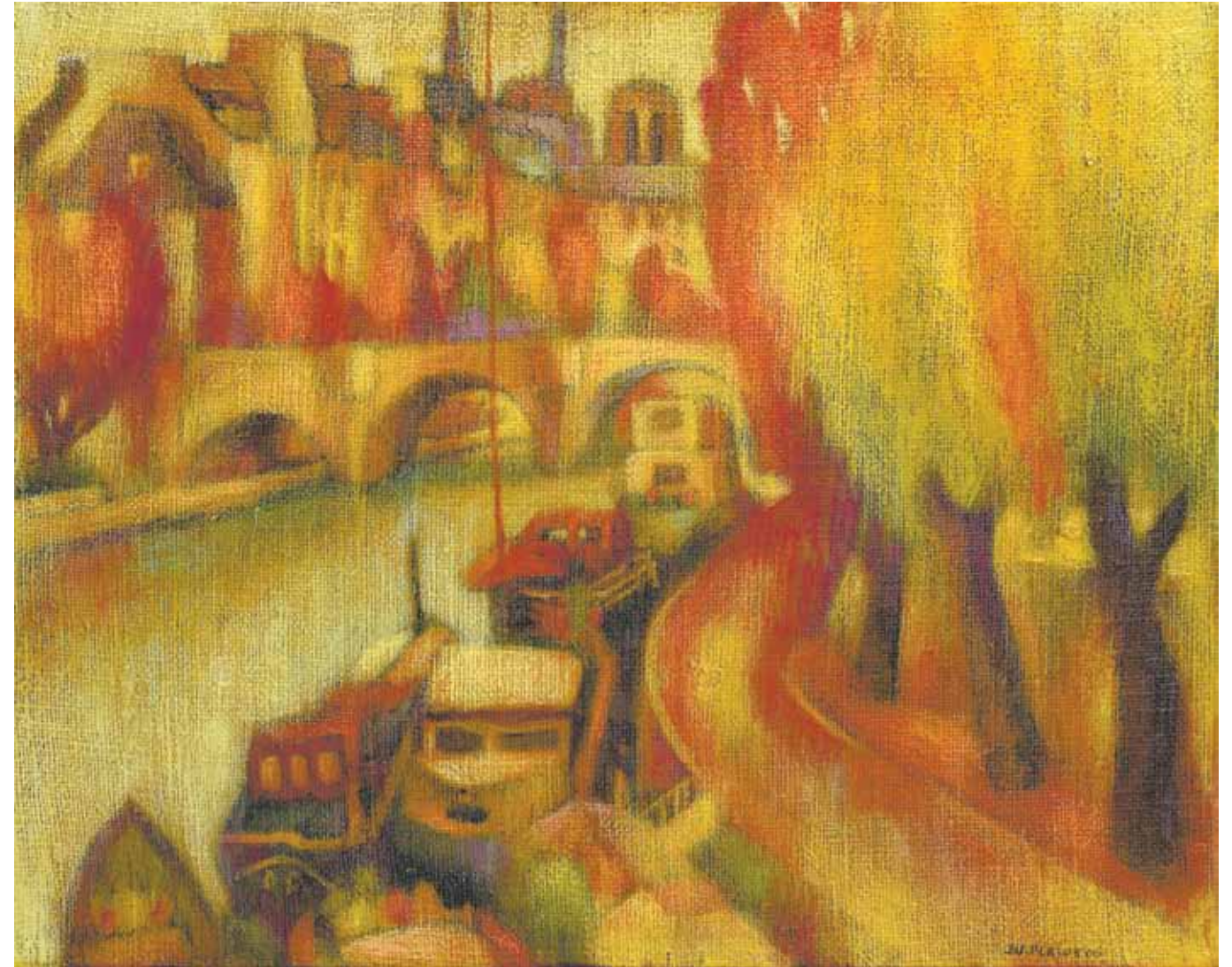
Peisaj 40 x 60 cm, ulei, pânză 1984