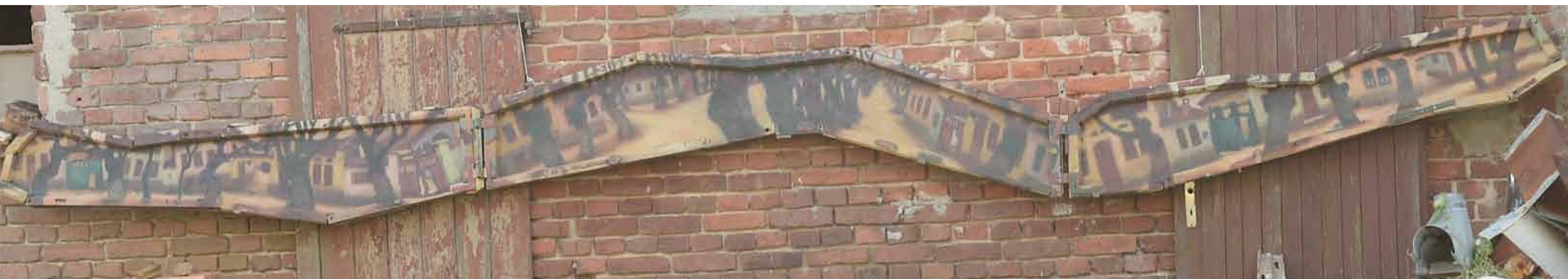
Orașul vechi I , 110 x 90 cm, ulei, pânză, 2010