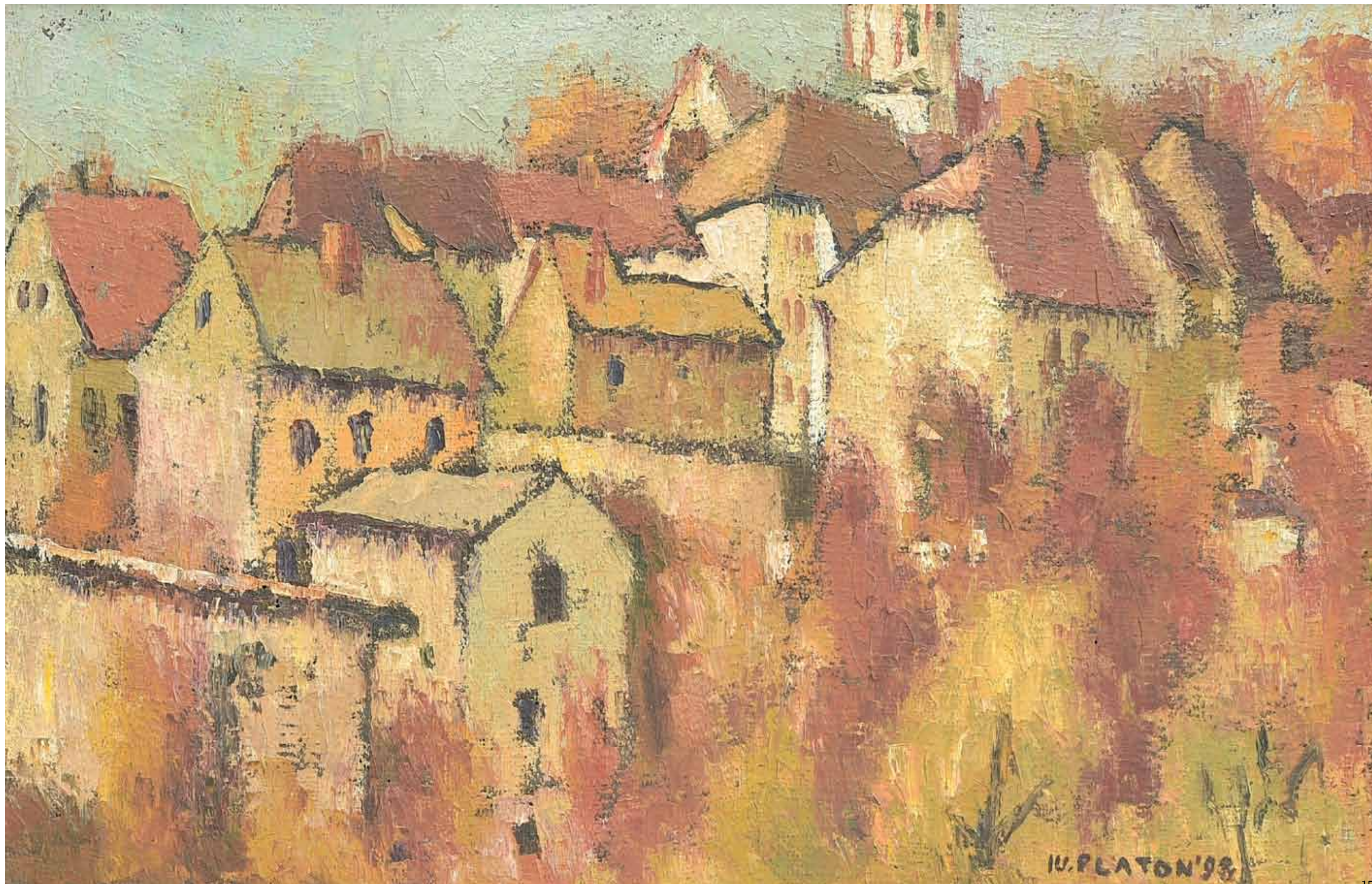
Peisaj , 40 x 60 cm, ulei, pânză 1984