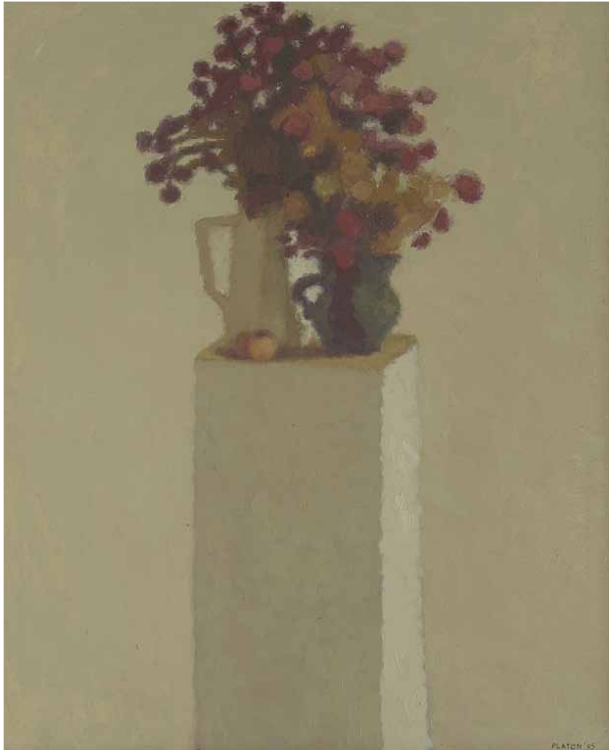
Natura statica , 200 x 300 cm, ulei, pânză, 1986