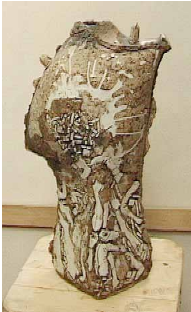
Tors , 60 x 80 cm, ceramică, 2015