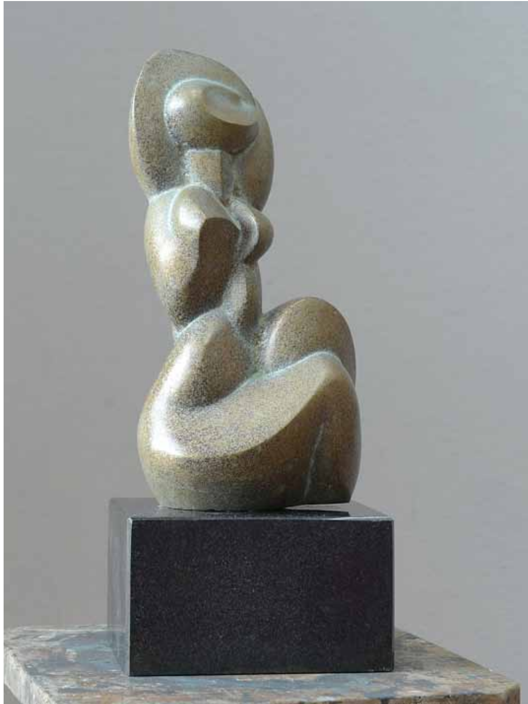
Tors , 60 x 80 cm, bronz, 2015