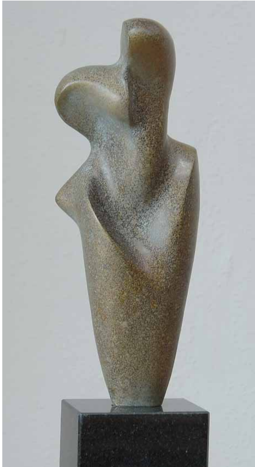
Tors II , 60 x 80 cm, bronz, 2015