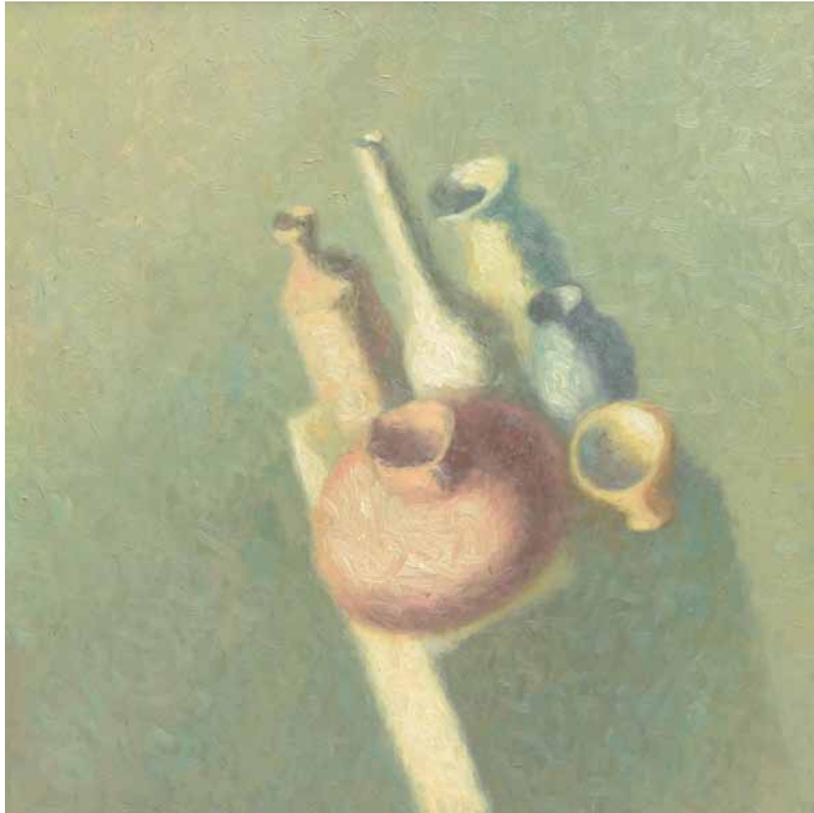
Natura statica , 200 x 300 cm, ulei, pânză, 1986