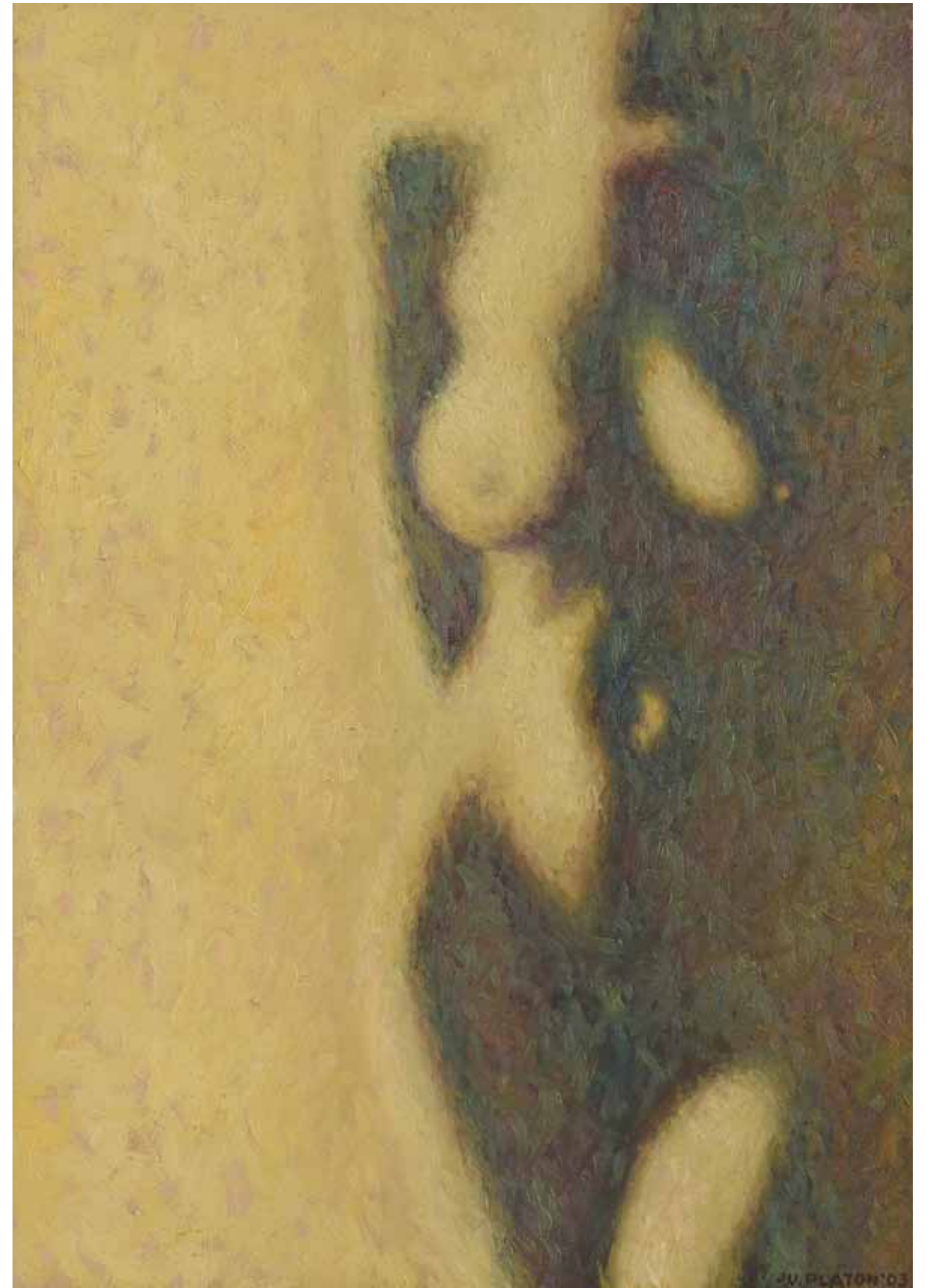
Nud , 200 x 50 cm, ulei, pânză, 1986