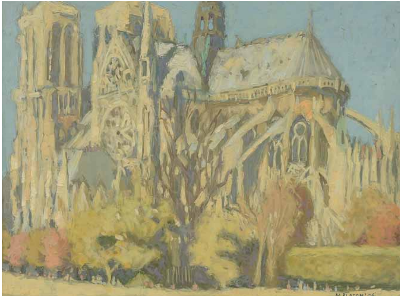
Paris , 110 x 90 cm, ulei, pânză, 2010