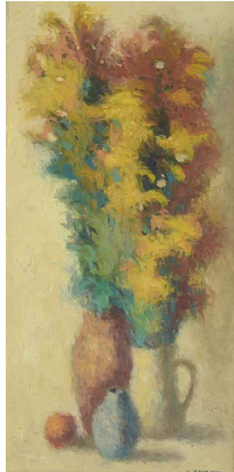
Natura statica II , 200 x 300 cm, ulei, pânză, 1986