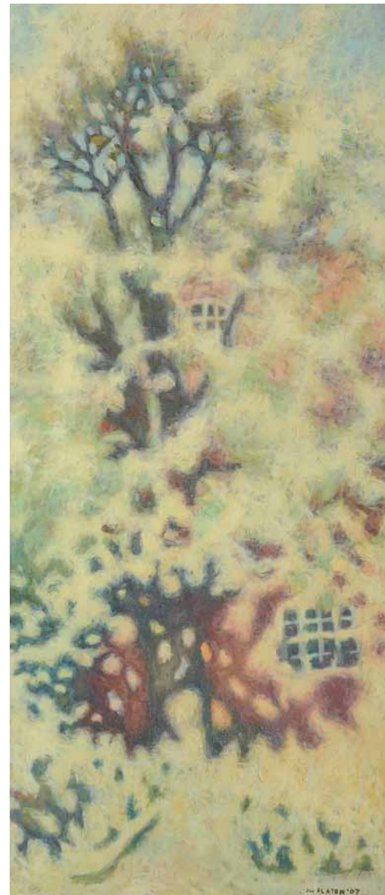
Peisaj , 80 x 60 cm, ulei, pânză, 2015