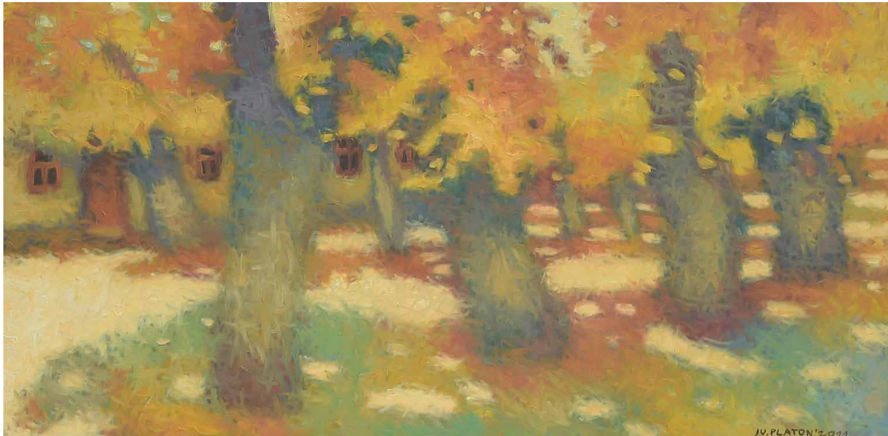
Peisaj 40 x 60 cm, ulei, pânză 1984