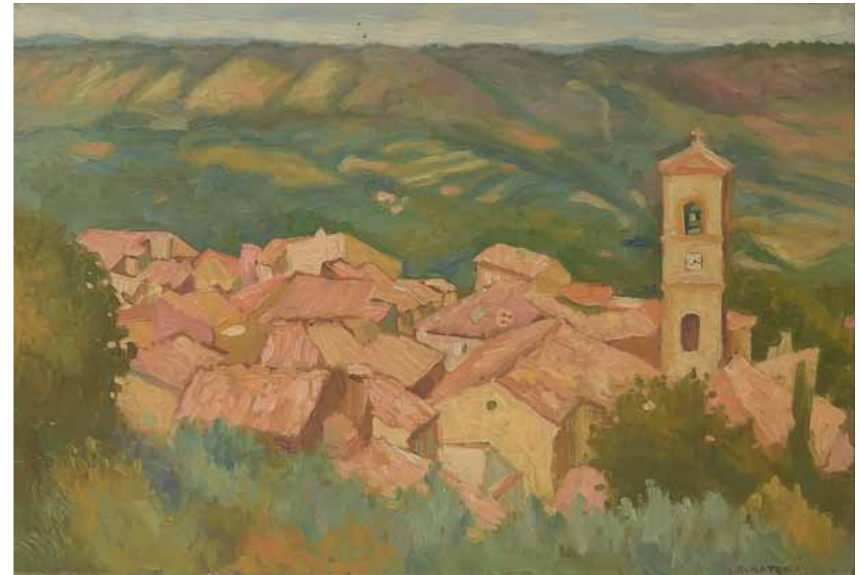
Peisaj IV , 110 x 90 cm, ulei, pânză, 2010