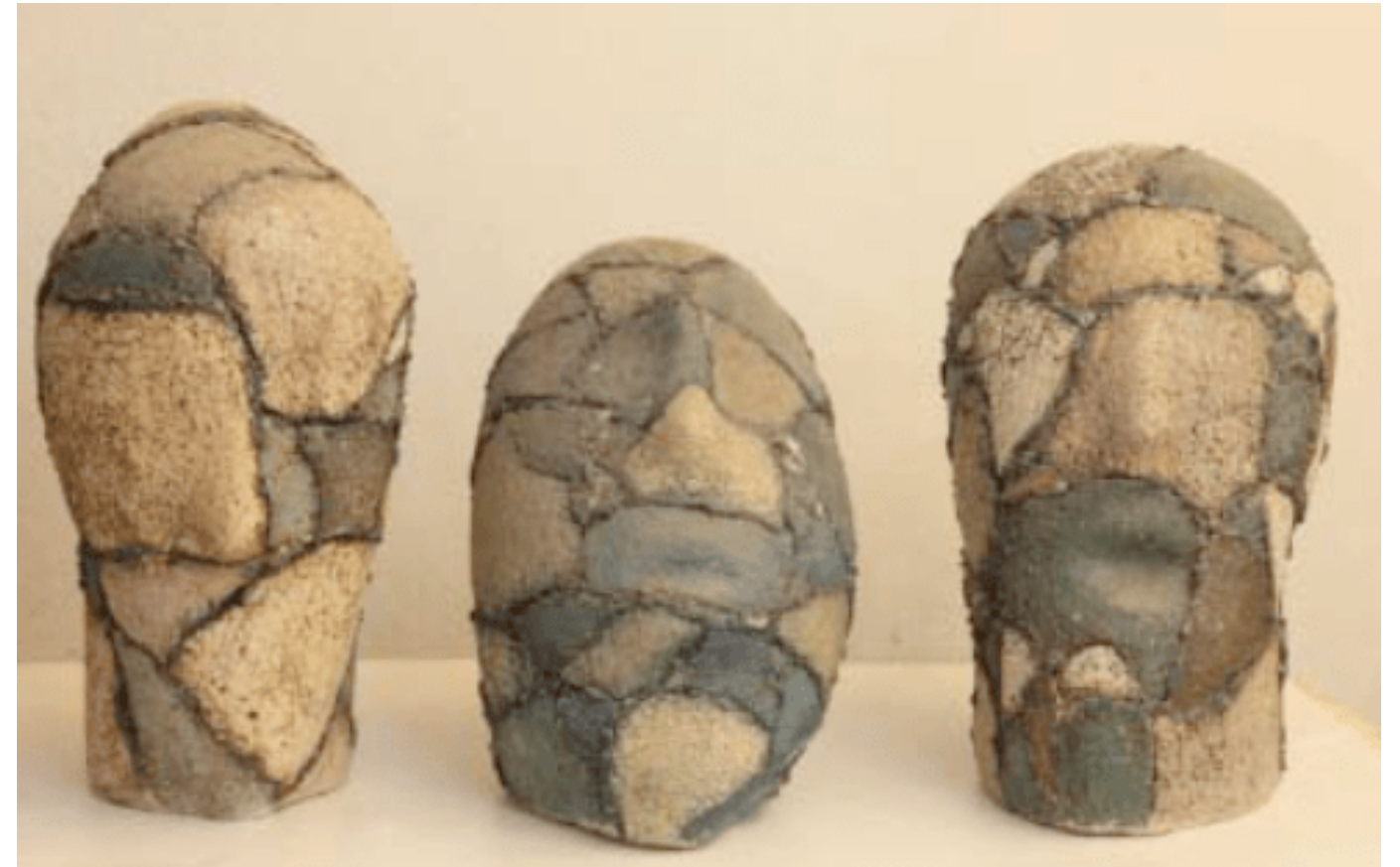
Trei , 60 x 80 cm, ceramică, 2015