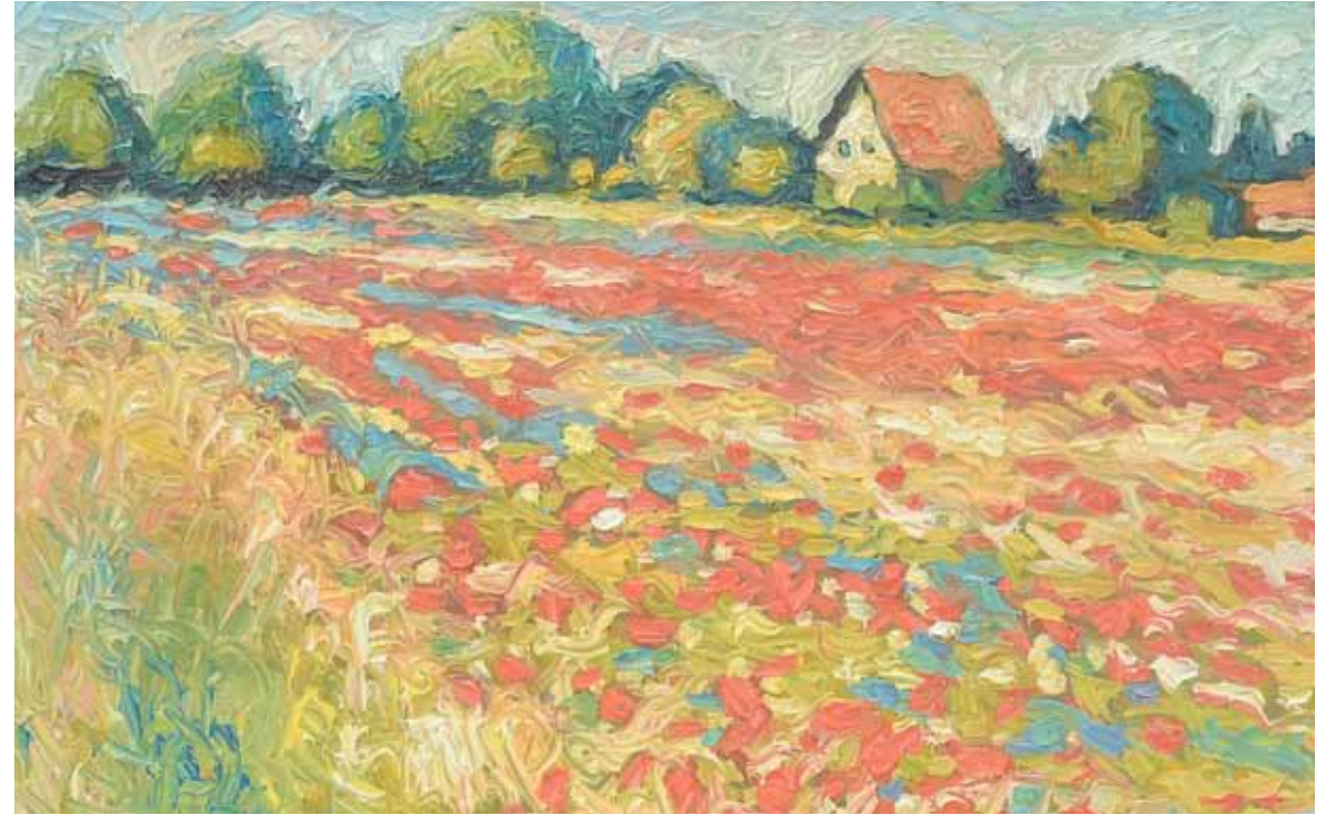
Peisaj III , 110 x 90 cm, ulei, pânză, 2010