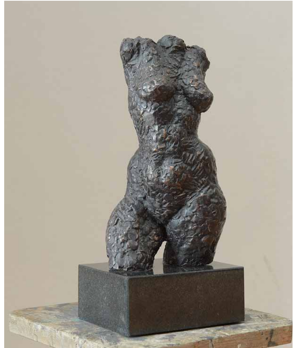
Tors II , 60 x 80 cm, bronz, 2015