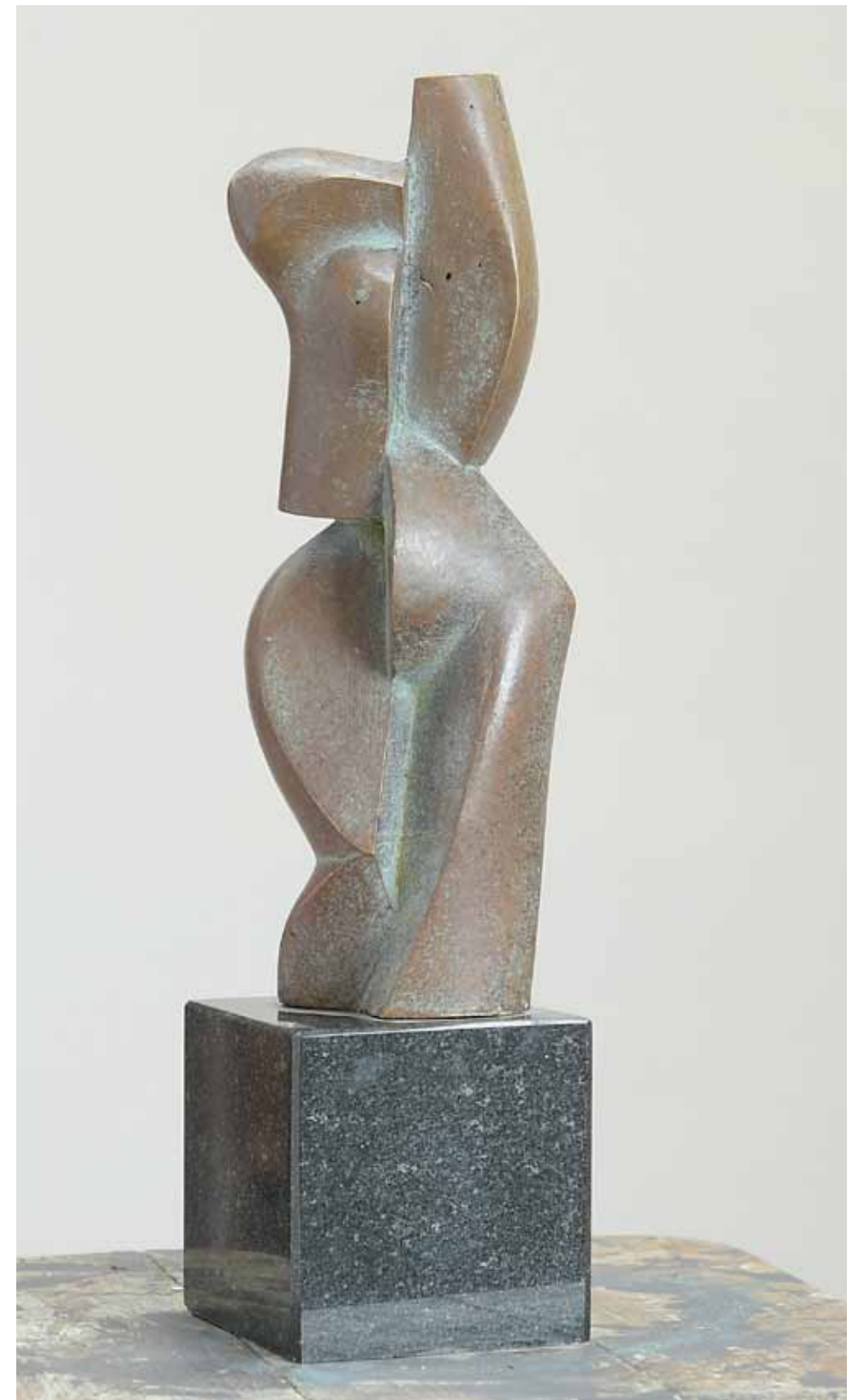
Tors IV , 60 x 80 cm, bronz, 2015