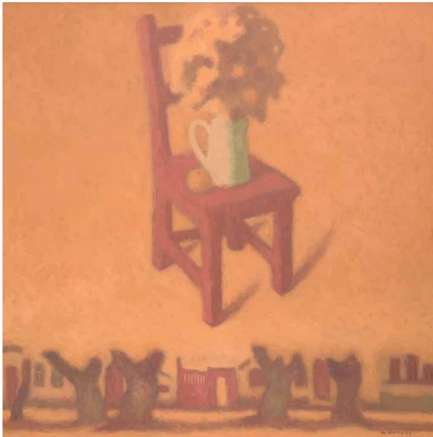
Orașul vechi III , 80 x 60 cm, ulei, pânză, 1996