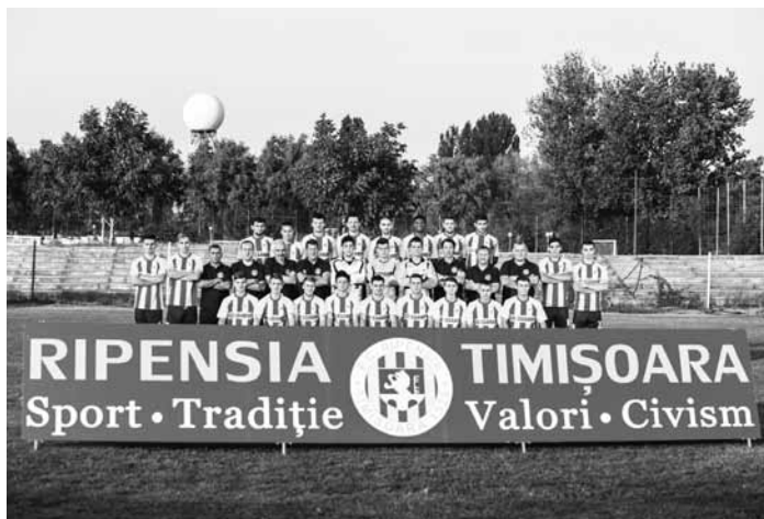
Ripensia Timișoara, 2014: 80 de ani după N. Simatoc.

prin performanțele internaționale, – redimensionează trecutul și prezentul fotbalistic al Banatului. Noua construcție a Ripensiei, concepută să fie una „pas cu pas”, fără arderea etapelor atât de necesare făuririi și dezvoltării unei asociații viguroase și trainice, este în măsură să devină purtătoarea visurilor sau speranțelor celor care păstrează în suflet acest nume.