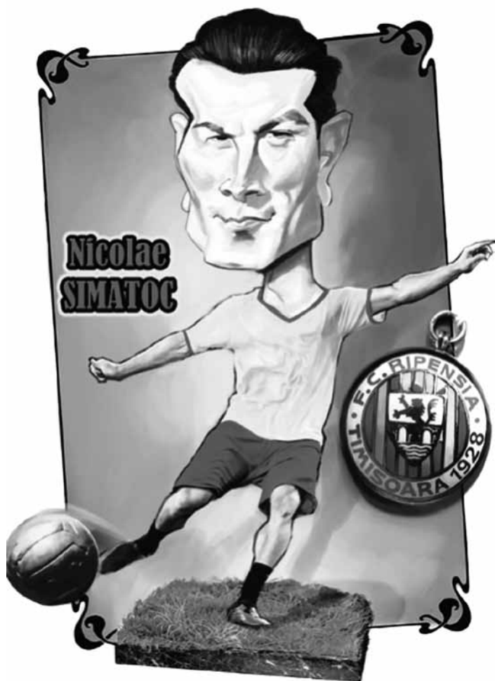
În ochii caricaturiștilor timișoreni, 2013.