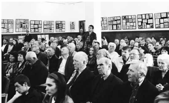
Secvențe de la lansarea cărții despre N. Simatoc la Biblioteca Națională din Chișinău, 20 aprilie 2013.

despre fotbalul est-european, și-a arătat cu generozitate disponibilitatea de a susține financiar proiectul despre Simatoc.