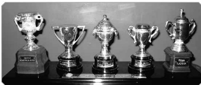
Replica celor Cinci Cupe, câștigate de N. Simatoc cu magnifica echipă a Barcelonei în ediția 1951/1952.