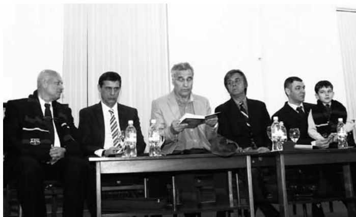
Secvențe de la lansarea cărții despre N. Simatoc la Biblioteca Națională din Chișinău, 20 aprilie 2013.

lumii. Datorită acestui interes, cartea urmează să fie tradusă în mai multe limbi de circulație internațională, unele cu referință la țările unde a trăit și a activat Nicolae Simatoc. Tocmai din respect față de țările în care a locuit și a jucat fotbal marele nostru conațional, am decis să publicăm la sfârșitul cărții rezumate în limbile catalană, italiană, maghiară și engleză, lucru care ne-a scăpat în prima ediție și pe care îl facem cu bucurie de această dată.